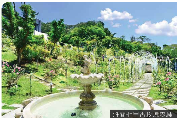
雅聞七里香玫瑰森林

落於純樸的三義小鎮。周邊除了大家熟悉的木雕藝術、勝興車站及龍騰斷橋等景點，還有代表客家文化的客家大院。