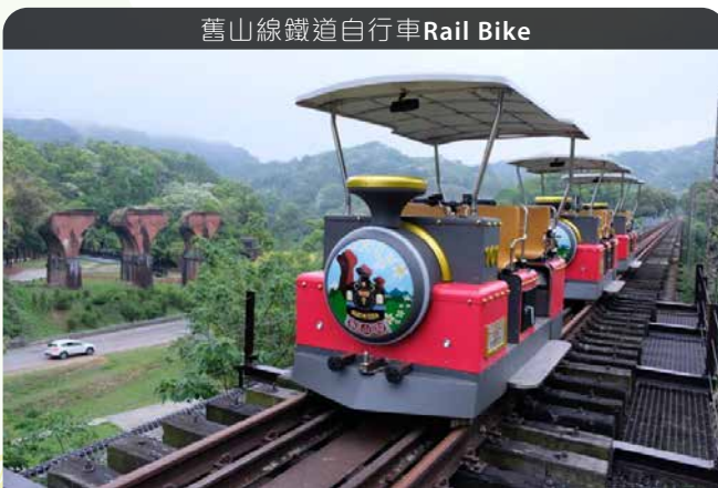
舊山線鐵道自行車Rail Bike