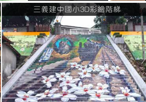
三義建中國小3D彩繪階梯